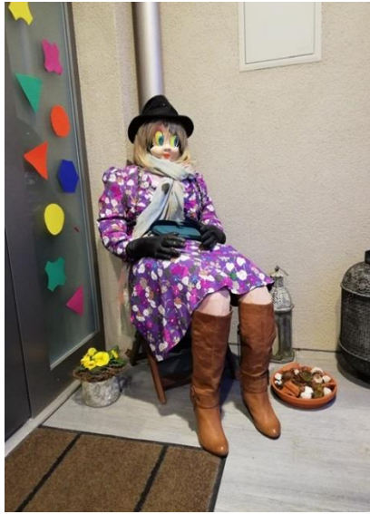
Lady am Mattenweg