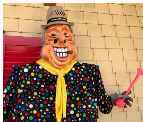
Sirenenalarm an der Schulstrasse