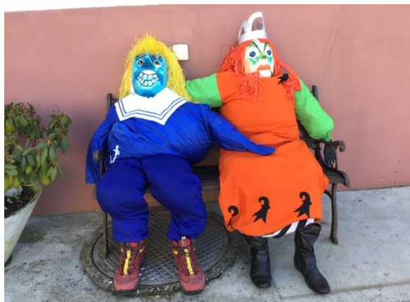
„Bauer, ledig sucht...“ vom Weiler Huggerwald

Ebenso auf grosses Interesse stiess der Aufruf zur Hausbeschmückung. Die nachfolgenden Bilder sagen alles aus: Einfach SUPER, diese kreativen Litzlerinnen und Litzler !!