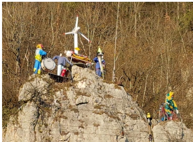
„Kabinett“ hoch über den Dächern von Litzel

An dieser Stelle möchten wir allen Laternen-Künstlern und Hausbeschrückungsdekorateuren ganz herzlich für das grosse Engagement danken. Zudem ein riesiges Kompliment für die kreativen Kunstwerke aussprechen.