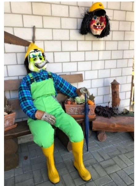
Hochwasser am Rütliweg